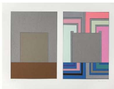
تصویر ۳، شبکه، اثر پیتر هالی اکریک، Day- Glo، روی بوم