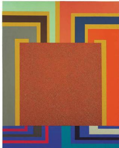
تصویر ۲، پالس ژنراتور، پیتر هالی، ۲۰۰۰، اکریک، Day- Glo اکریک متالیکی و Rol-a-text