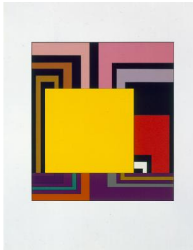
تصویر ۱، بی‌مرا بین، پیتر هالی، ۲۰۰۱، سریگرافی روی کاغذ