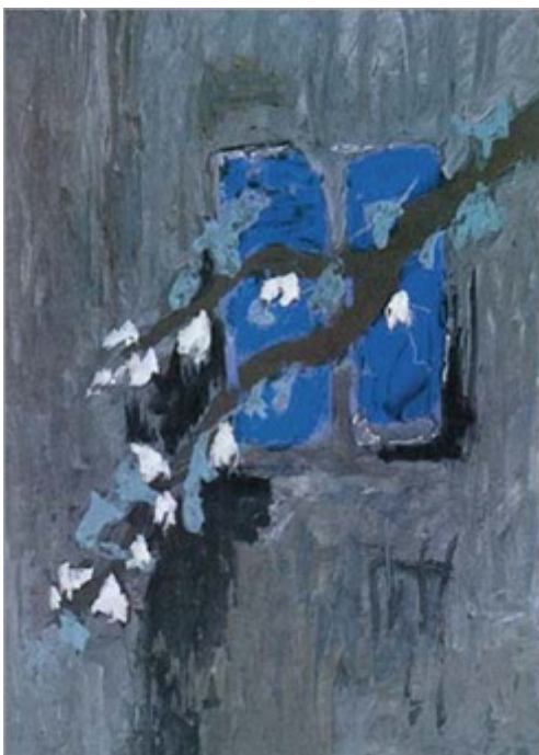
شکل ۲ سهراب سپهری