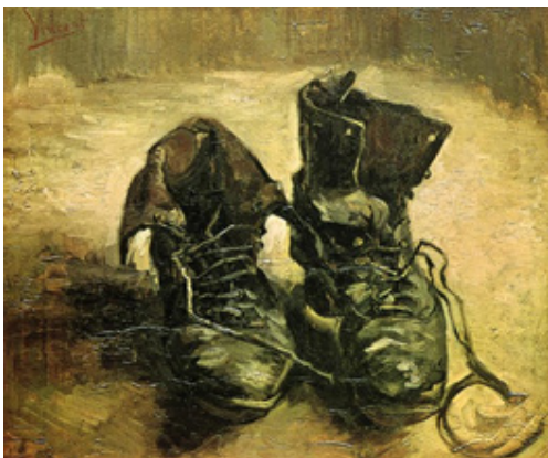
شکل ۲ کفش‌های وان‌گوت - ۱۹۸۶ منبع: