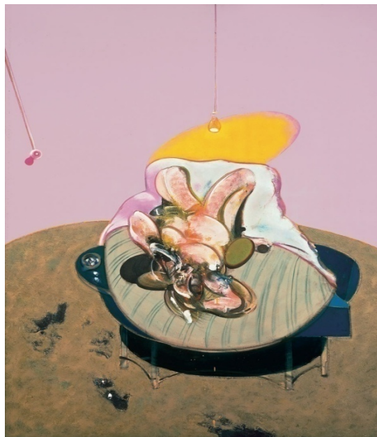
شکل ۲: فیگور دراز کشیده، فرانسیس بیکن، ۱۹۶۹. خط مرز نما در اینجا به صورت بیضی زرد رنگ دیده می‌شود.